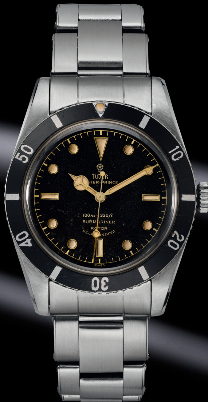
Ref. 7922, 1954

碧湾系列回溯传统，秉承经典，始终尊崇奠定帝舵表独特美学风格的重要设计。它融入了品牌历代潜水腕表的核心设计元素，而碧湾 54 型或许是迄今为止最忠实于经典的表款。其原型——帝舵表 Oyster Prince Submariner 7922 型无疑是一款值得借鉴的杰作，不仅为海军认可并采用，且广受专业潜水员追捧。7922 型初代表款采用“小表冠”设计，12 点钟位置并未设置红色三角标记，以此缔造更为简洁统一的外观。碧湾 54 型沿袭了该传统，并力求通过一系列微妙的细节设计，成就非凡魅力。以指针为例，其比例经过调整更符合现代审美，但其固定于底部的做法又与 1954 年的经典设计如出一辙。外圈边缘也在 7922 型的原始基础上进行革新，既符合人体工学，更体现现代风格。饰以精致放射纹的磨砂表盘以及便于调节的“T-fit”带扣，都赋予了碧湾 54 型更摩登时尚的个性。而帝舵表原厂机芯 MT5400 型则以先进技术保障了腕表的卓越性能。