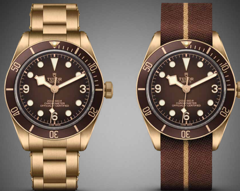
ファブリック製コンプリメンタリーストラップ