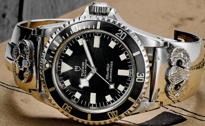
2023, Pelagos FXD réf. 25717N 1968, Oyster Prince Submariner réf. 7016